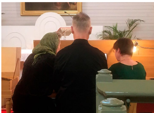
◆ Wilhelm Friedrich Ernst Bachs „Dreyblatt“ für 3 Spieler an einem Instrument