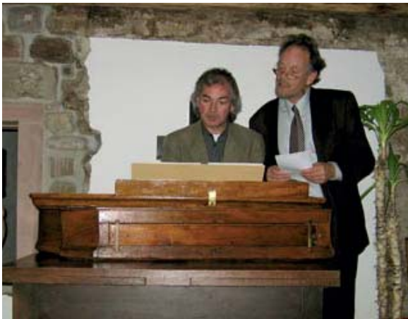
◆ Die Leitung des „Clavichors“

Nach dem Konzert wechselten die Teilnehmer in den gegenüberliegenden Weinkeller. Ein Drei-Gänge-Menü mit den dazu passenden Weinen eines ortsansässigen Winzers regte zum munteren Gedankenaustausch an. Und da („frühe“) Tafelklaviere leicht zu transportieren sind, wurde ad hoc ein Clavichord gegründet. Matthias Claudius' „Mainweinielied“ und Friedrich von Matthisons „Trinklied“ trafen das Thema des Abends, waren leider sehr unbekannt und unbedingt noch verschönerungsfähig. Das bekannte deutsche Volkslied nach Worten von Johann Wolfgang von Goethe „Der König von Thule“ war etwas traurig zu diesem Anlass, konnte aber sängerisch bestehen. Ein „ganz normaler“ Tag der 24. Clavichordtage ging zu Ende.