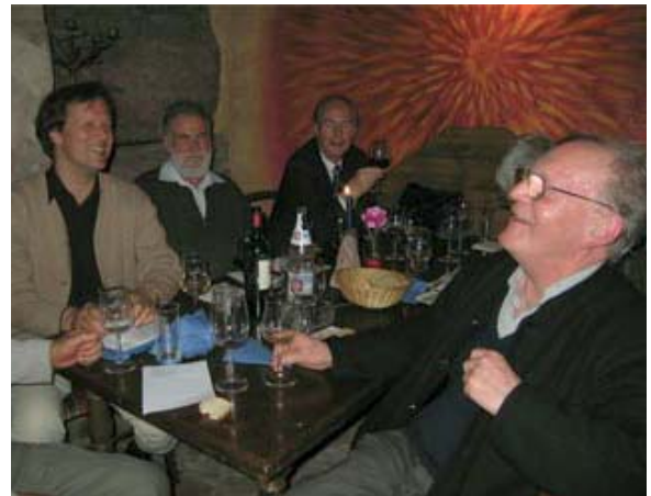
◆ Gelöste Stimmung beim Frankenwein