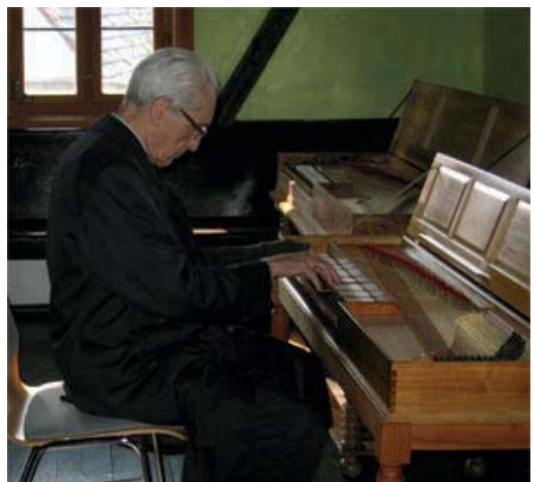
◆ Gustav Leonhardt beim Improvisieren in der Clavichordausstellung