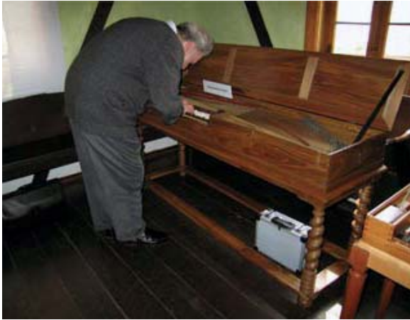
◆ In der Clavichordausstellung