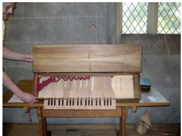
◆ In der Ausstellung, Clavichord nach „Urbino“, gebaut von Th. Glück