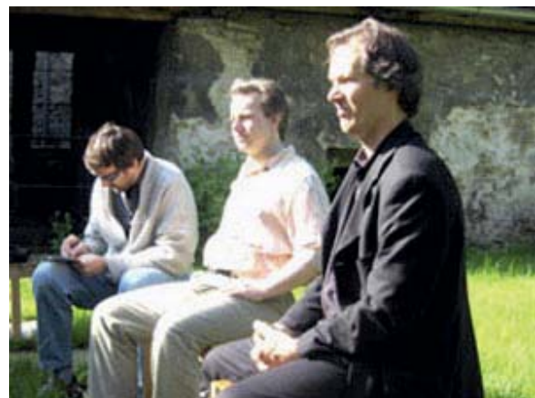
◆ Zuhörer im Klostergarten