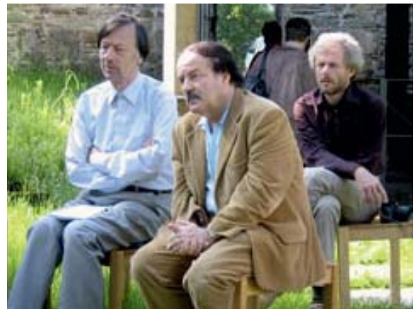
◆ Zuhörer im Klostergarten