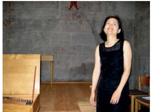
◆ „Es ist geschafft“