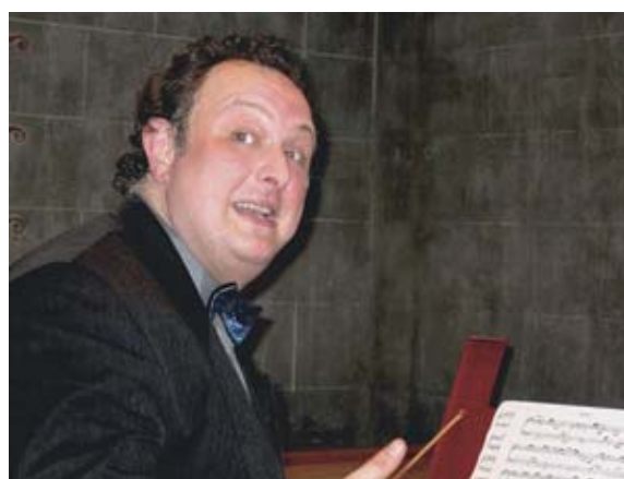
◆ Konzert Siegbert Rampe