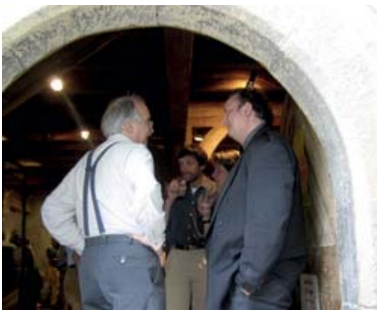
◆ Im Eingang zur Klosterkirche